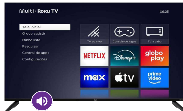
ÁUDIO 2x10 WRMS